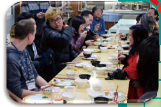
그린하우스에서 잠을 자고 저녁식사와 아침식사를 했습니다.