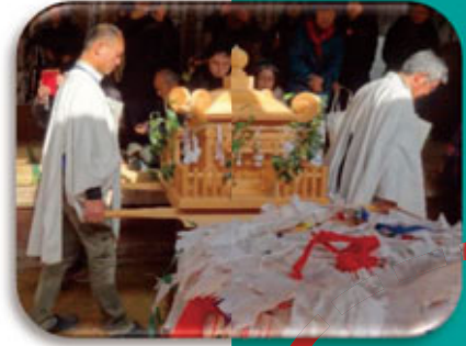
강인한 신들의 마음을 다스립니다.