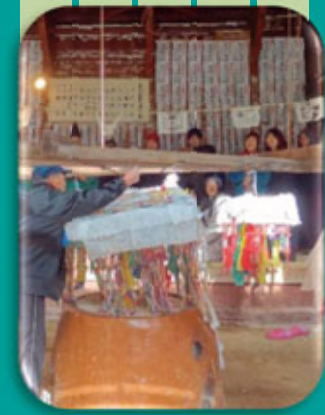
춤이 끝난 뒤, 신과 부처님을 돌려보내기 위한 의식을 행합니다.