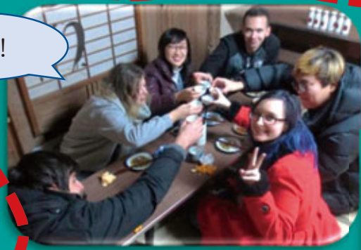
회장에서는 일본술과 두부말이튀김(반찬), 장아찌, 된장국, 밥을 대접합니다.